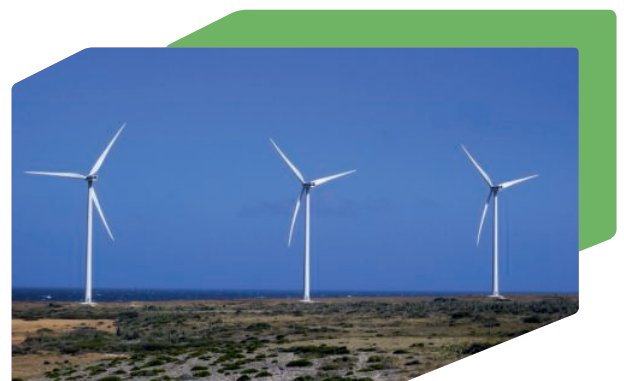
Centrale eolica: progetto di compensazione CO 2 a Vader Piet, Aruba

Utilizzando di dispositivi di stampa a impatto zero, si supporta il progetto certificato di riduzione emissioni (CER) a Liaoning, in Cina. Nella regione del carbone, grandi quantità di gas metano vengono estratte dai pozzi sotterranei per mantenere la sicurezza nella miniera di carbone. Questo gas viene raccolto e riutilizzato nella regione.